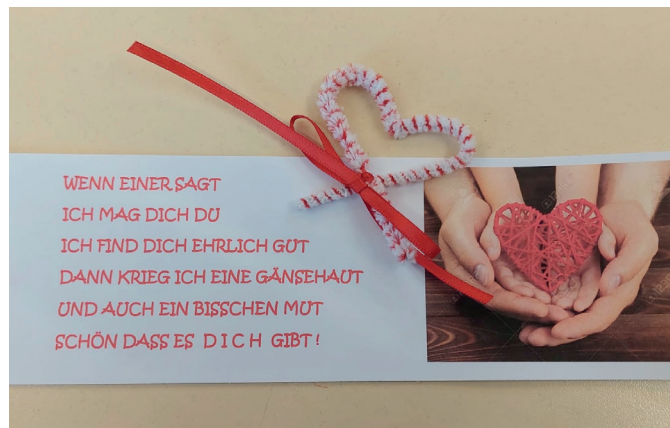
Die Jungscharkinder hatten kleine Herzen als Danke für alle Mütter und Omas gebastelt und nach dem Gottesdienst ausgeteilt.